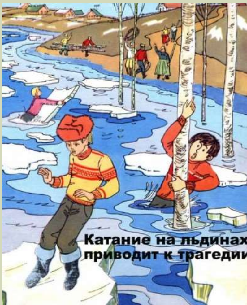
Катание на льдинах приводит к трагедии

Приближается время весеннего паводка. Лед на реках становится рыхлым, «съедается» сверху солнцем, талой водой, а снизу подтачивается течением. Очень опасно по нему ходить: в любой момент может рассыпаться под ногами и сомкнуться над головой.